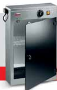
STERILIZZATORE UV 16 W