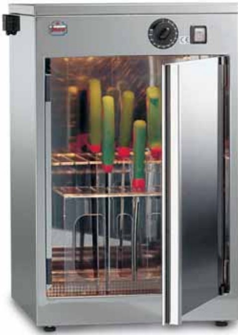
STERILIZZATORE UV 24 W