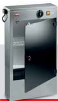
STERILIZZATORE UV NAPOLI 16 W