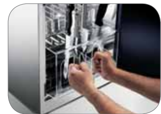
1. Portacoltelli asportabile su mod. 24 W Knife storage unit removable for mod. 24 W

Q.tà lampade e potenza Nr. of lamps and power Nr. Lampen und Spannung Nr. Lampes et puissance